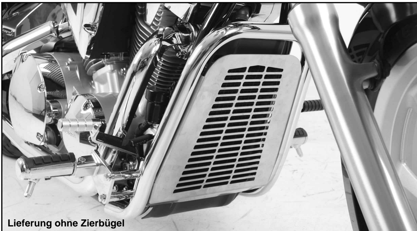
Lieferung ohne Zierbügel

HINWEIS: die Kühlerabdeckung ist nicht montierbar, wenn ein Original-Honda-Bugspoiler montiert ist.